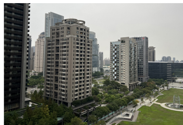
2023台中市購物節，消費金額登錄參加抽獎，排除買房買地等交易項目，回歸專屬消費。