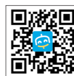
下載「台中通暨購物節」APP

數位局也提到，台中通暨購物節APP更進一步整合數位市政服務，如線上申辦的「服務e櫃台」、向市府陳情或提供建議的「陳情整合平台」，甚至是線上預約流感、新冠疫苗施打的「疫苗預約系統」，都整合在台中通。在全府APP管理上，數位局積極輔導各局處開發APP優化升級與整合，從去年底數位局成立時全市府APP有14個，截至目前已合併至10個，發揮整合效果。