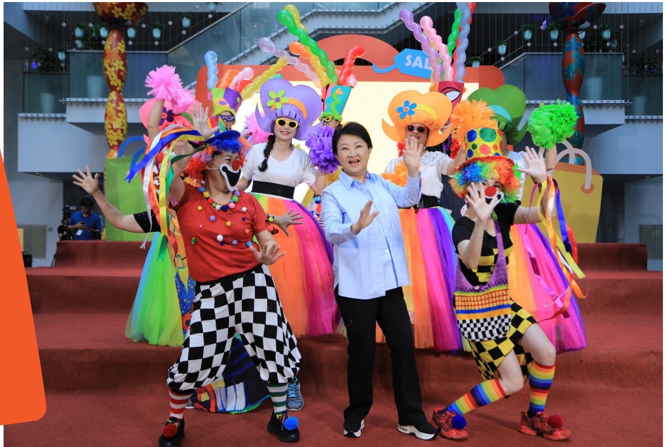
2023台中購物節，「媽媽市長」盧秀燕擔任代言人。