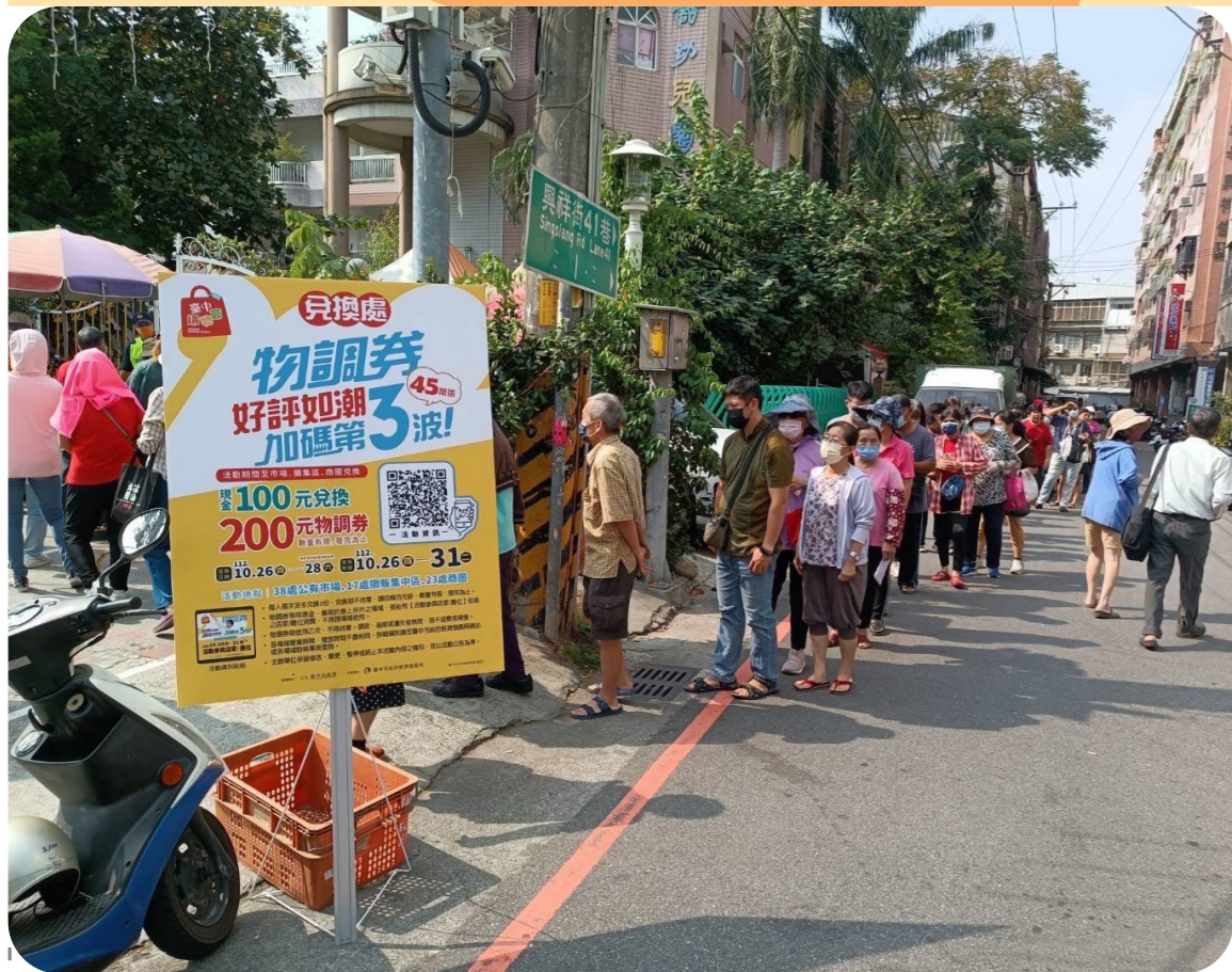
物調券10月26日至28日在夜市、市場發放，吸引民眾大排長龍領取，為台中購物節打頭陣。