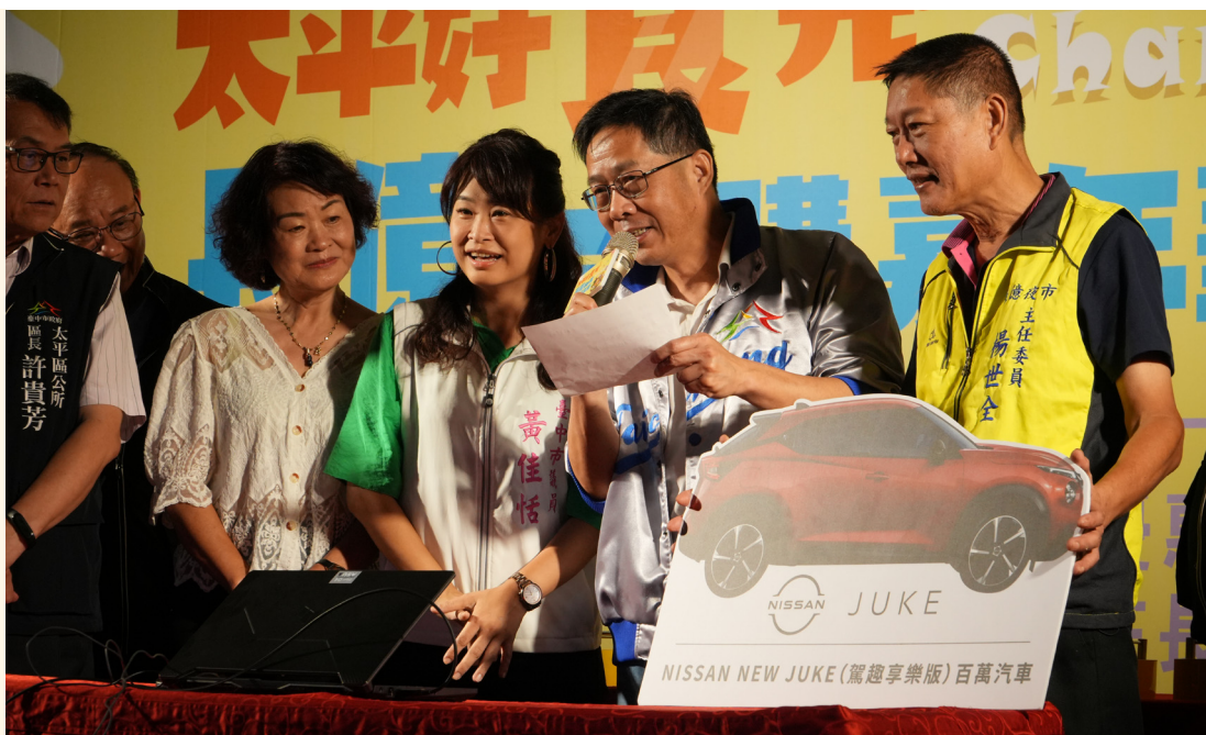
今年購物節首位百萬汽車得主11月4日於「太平好食光 長億Go購嘉年華」活動中抽出，經發局長張峯源(右二)call-out給得主。

台中購物節開跑了，現金、汽車、精品好宅等您抽！今年的購物節有下列重要新措施：第一，本屆排除「土地」、「房屋」的購買金額登錄。第二，今年加碼推出「區域(大安、石岡、外埔、新社、和平、東勢、大肚、神岡、霧峰、龍井等10區)消費/收據專屬抽」的合作店家，消費累計金額享5倍送，且每日抽獎從去年100組增至今年200組，藉此帶動這10區的消費，並且促進庶民經濟。此外，台中購物節APP升級成「台中通暨購物節」APP，不僅延續原有的消費登錄、線上兌獎等功能，更整合市府多項數位服務。秀燕在這邊祝福大家心想事成，滿載而歸，為今年畫下完美的句點。