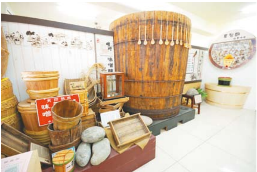
▲台灣味噌釀造文化館有各式各樣釀造味噌的桶具、湯匙、石頭等。

臺中市人文薈萃，傳統民生產業很多，但經過歲月洗禮，傳統產業也得隨著經濟環境變遷，思考轉型或觀光工廠：臺中市各區都有不少成功案例，如糕餅、樂器、科技、中藥等行業，在各區大放異彩。