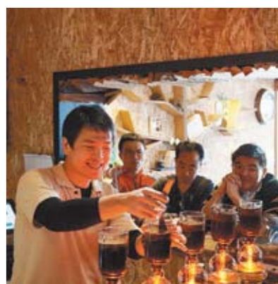
▲臺中市咖啡館多元，風格各異，也營造出獨特的城市風情。

另外，在活動期間，有20家咖啡店、10家糕餅業者加碼祭出優惠方案，只要在咖啡週期間（3月15日至4月14日）來消費，可享有特別優惠或折價，除有消費優惠外，詳細活動訊息可上網http://www.taichung-cafe.com/。