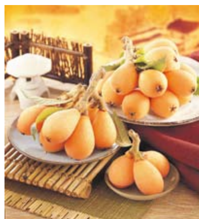
▲現在是枇杷的產季，臺中市太平及新社區的枇杷品質有保證。

枇杷享有「水果王」美名，今年產量少，但價格卻比以往便宜。新社區農會表示，受去年雨季影響，頭櫃、二櫃產量少二至三成，但今年農曆年二月中旬才結束，枇杷買氣受影響，價格「很親民」，高價位枇杷零售價一斤230~250元(十二粒裝)，中價位(十五粒裝)約下降20元。