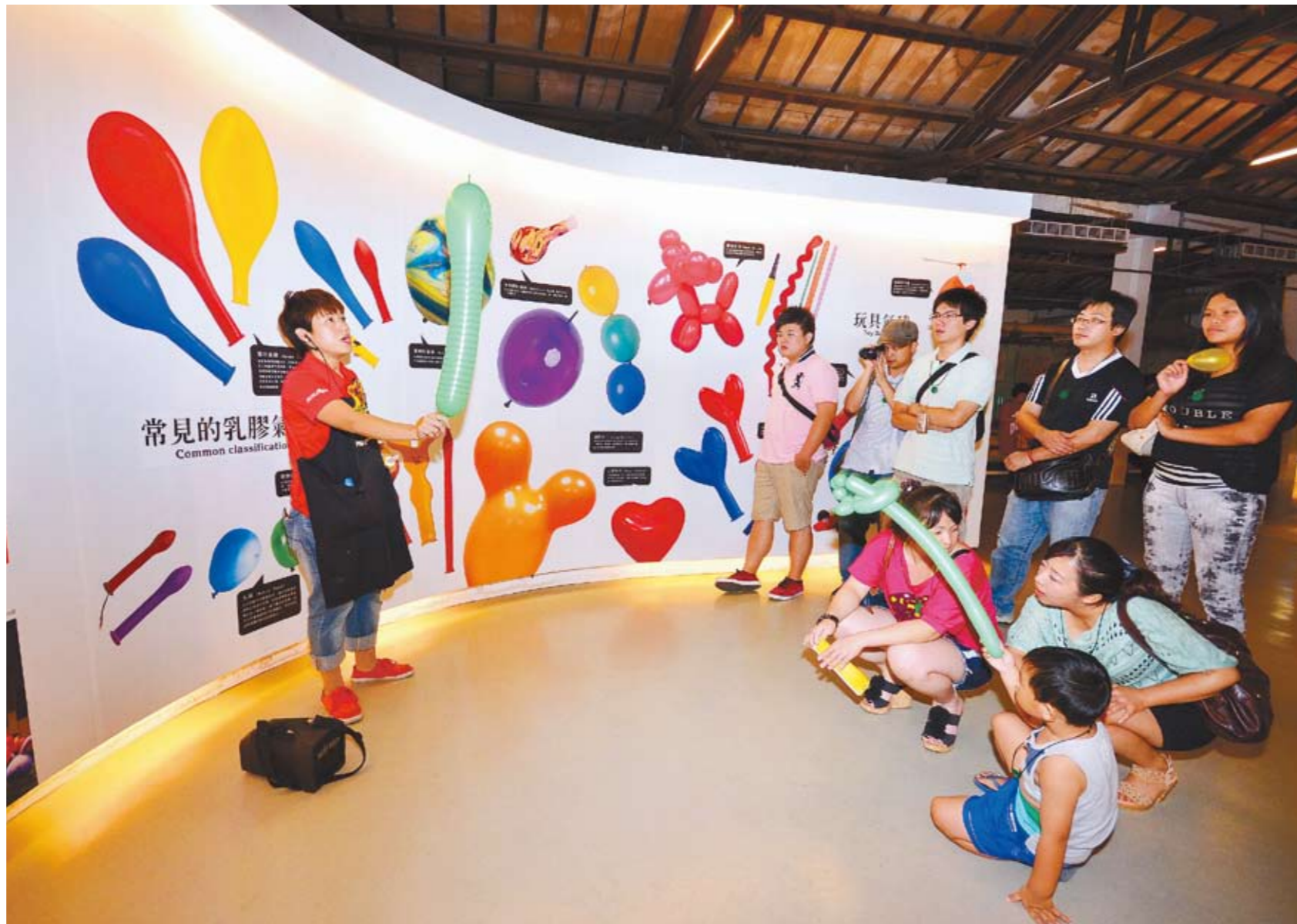
▲位於神岡的台灣氣球博物館，讓民眾認識氣球的發明與演進。

全臺第一家木頭觀光工廠「老樹根魔法木工坊」，就是一個能讓大人、小孩都放心在這敲敲打打的地方，老樹根公司原為生產製造原木教具、兒童玩具、涼亭、花架、景觀木作的木工坊，民國94年獲經濟部輔導轉型為