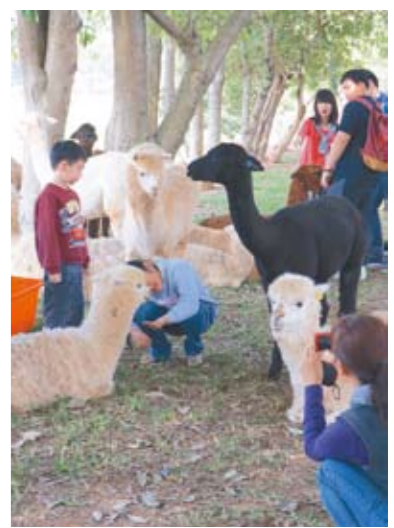
▲可愛的草泥馬搬新家，遊客可近距離接觸。

省農會休閒農牧場地址為臺中市外埔區水美里山腳巷56號。詳細遊園資訊可上網查詢，網址：http://www.skyzoo.com.tw，電話04-2683-4388。