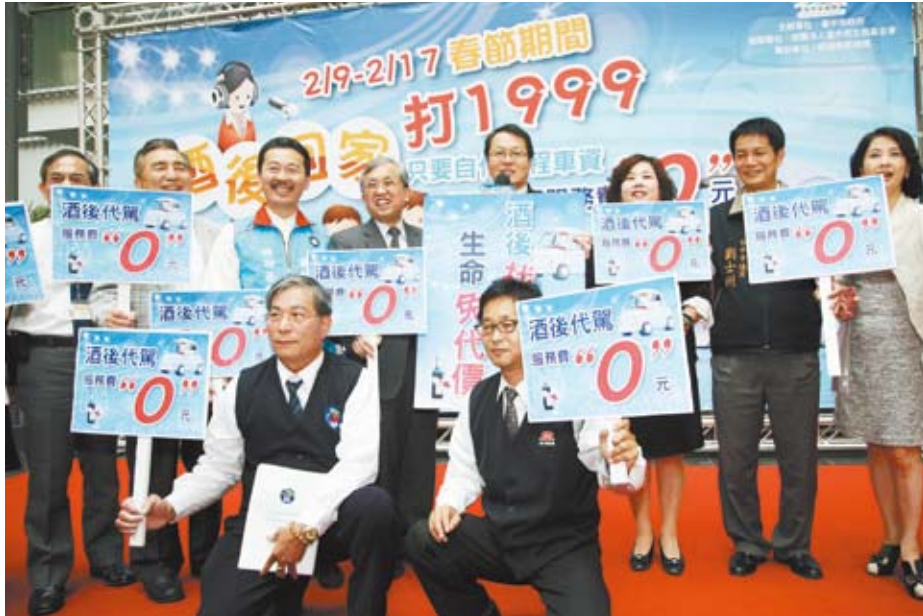
▲ 防範酒後駕車，臺中市政府在今年春節首推「酒後代駕免費」服務。

贊助「酒後代駕服務」的群園基金會，長期投入社會公益，除了今年這筆200萬元的捐款，去年也捐助社會局500萬元，