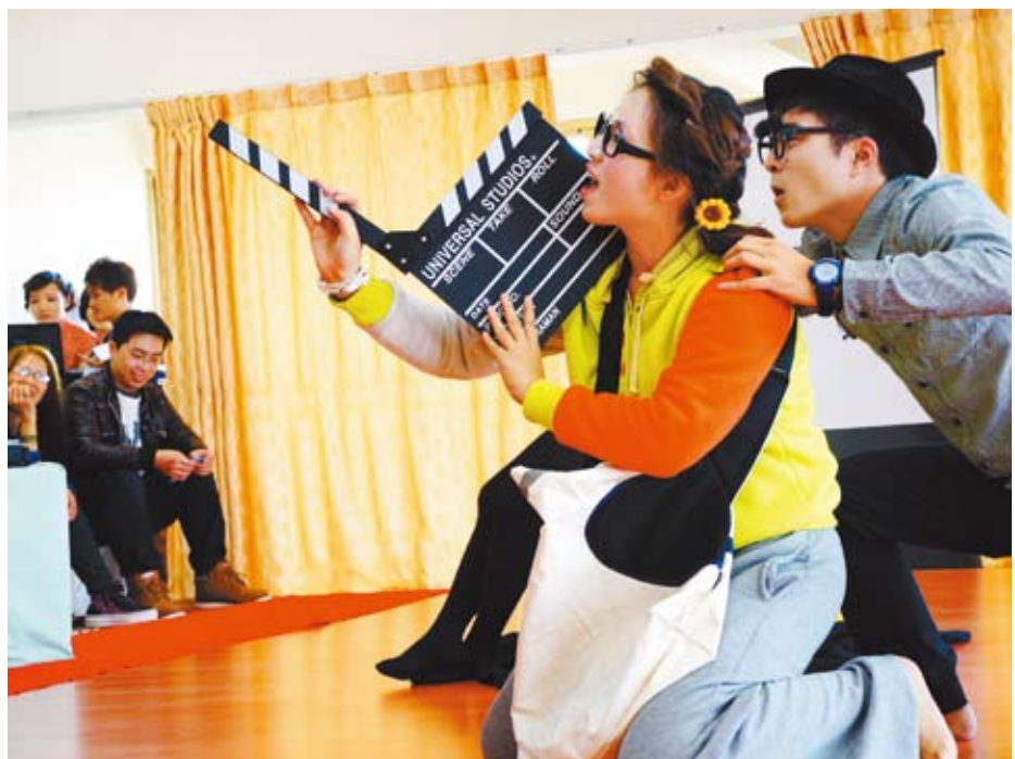
▲ 上劇場為了理想堅持下去，要讓臺中喜愛戲劇的年輕人不必再流浪。

她也希望臺中未來有天可以成為法國的戲劇重鎮「亞維儂」(Avignon)、一個真正有豐富心靈生活的都市，遊客到了臺中不再只是買太陽餅，還能看一齣劇再走。